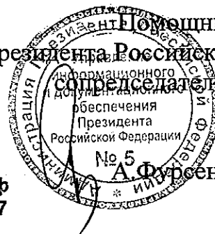
№ 5 А. Фурсенко

Помощник Президента Российской Федерации, сопредседатель совета